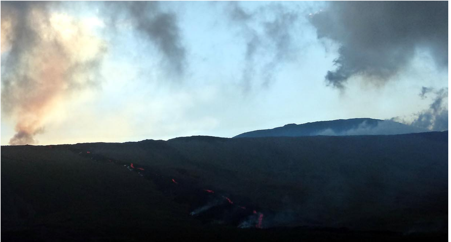
La bouche éruptive est bien visible: l'activité continue