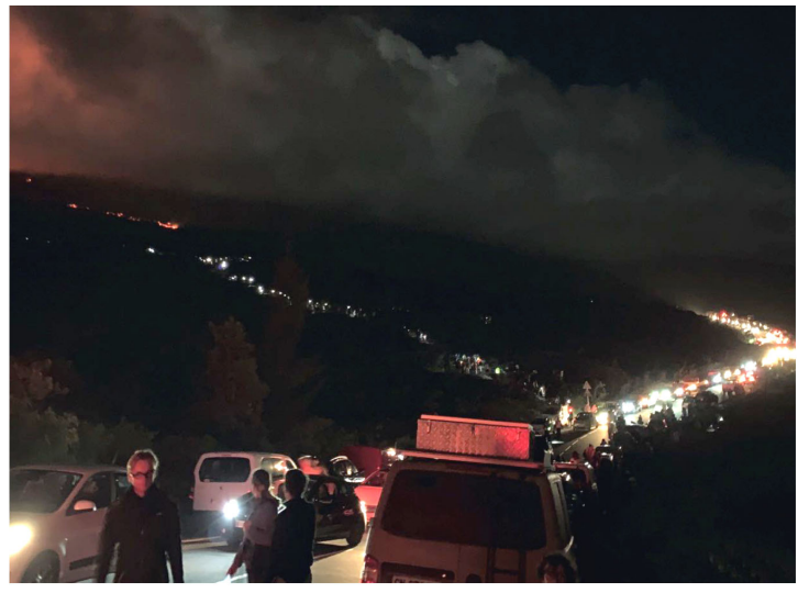
Nous sommes arrivés à 15h: la Route des laves est encore bien accessible... à la nuit, grosse affluence !