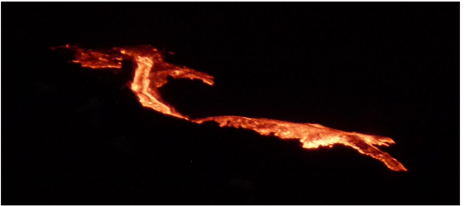
La prise de vue en Mode Manuel, le Lumix sur le Pied, Zoom X20 à 25