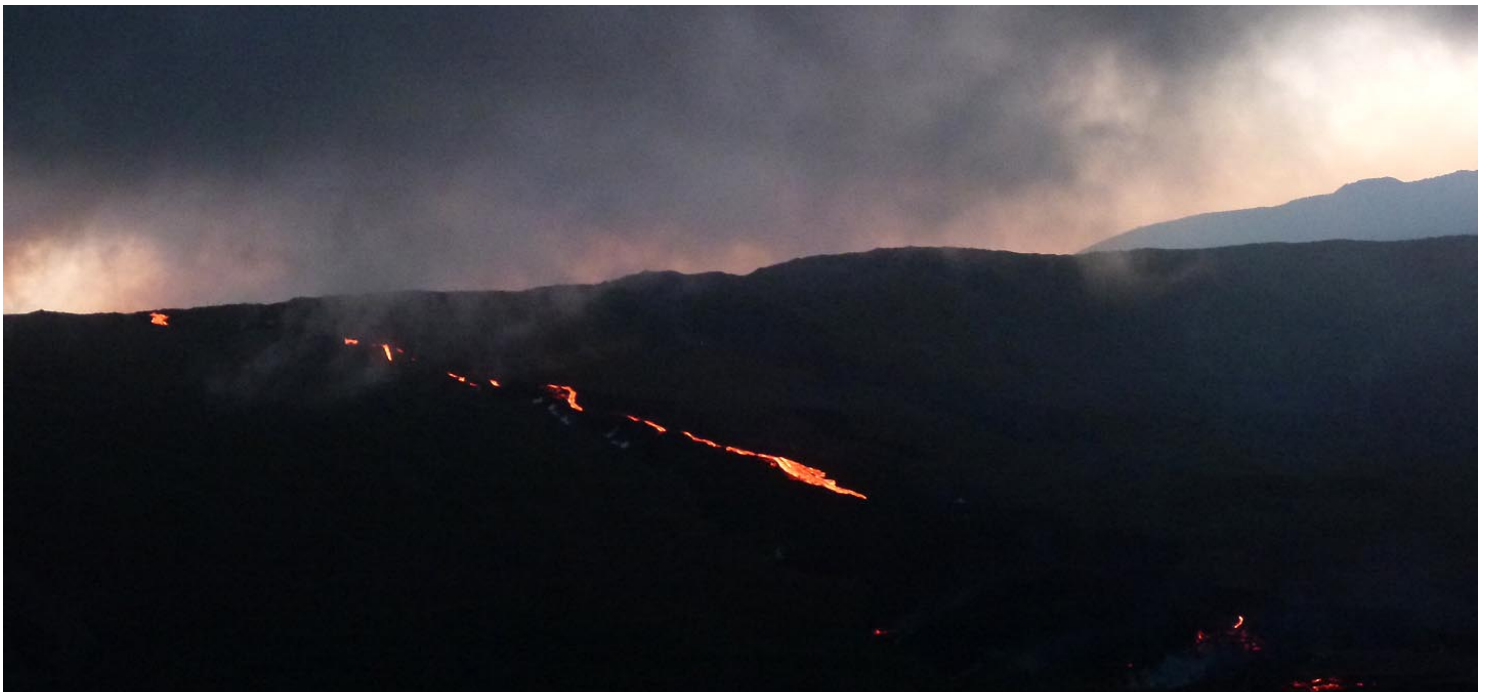
Quand la lumière diminue, le spectacle est bien visible, d'assez loin cependant (le front de lave est à 2 km)