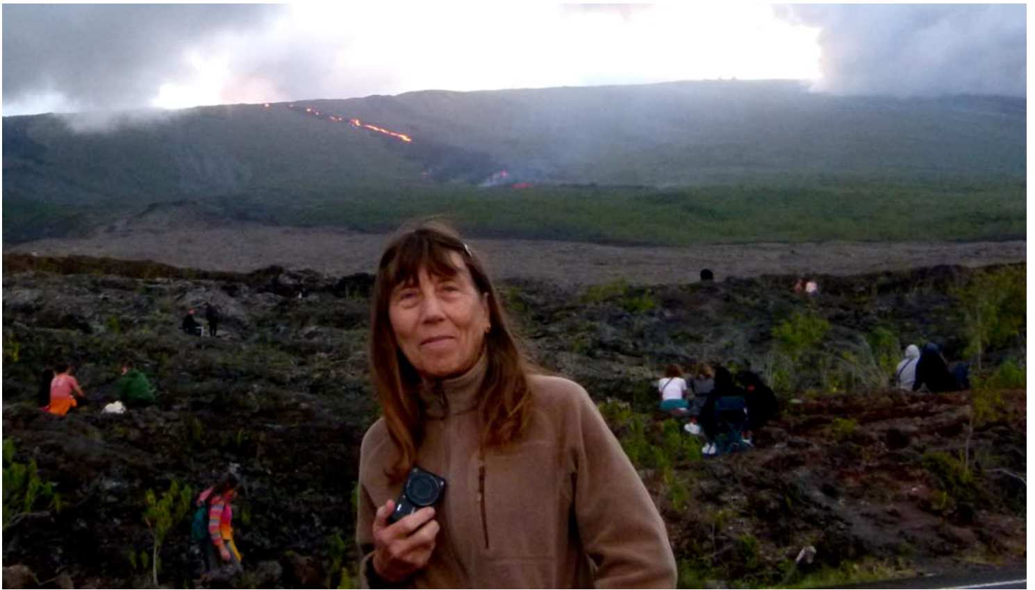
Au soleil couchant, la coulée de lave apparaît